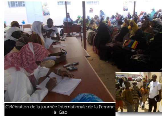
Célébration de la journée Internationale de la Femme à Gao

Conscient de la nature transversale des questions de conduite et discipline, CDT a participé à l'organisation et à la célébration de la Journée Internationale de la Femme au siège de la MINUSMA à Bamako et à Gao en menant des activités comme une campagne d'affichage et en répondant aux questions de la population locale. L'objectif principal de ces activités était de faire de la sensibilisation sur la politique du Secrétaire-général des Nations Unies en ce qui concerne la politique de tolérance zéro envers tous les actes de mauvaise conduite et de l'exploitation et des abus sexuels en particulier.