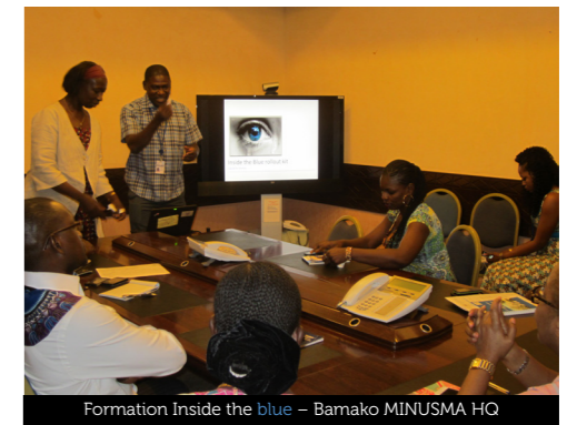
Formation Inside the blue - Bamako MINUSMA HQ