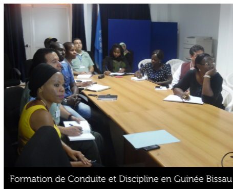
Formation de Conduite et Discipline en Guinée Bissau