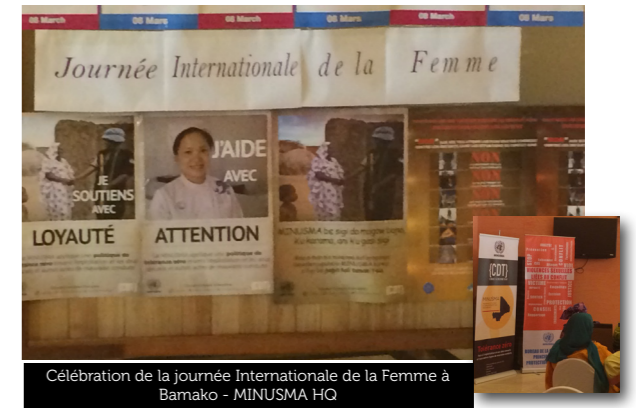
Célébration de la journée Internationale de la Femme à Bamako - MINUSMA HQ