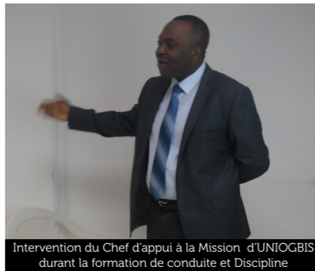
Intervention du Chef d'appui à la Mission d'UNIOGBIS durant la formation de conduite et Discipline

L'audience était composée des membres du personnel civil et en uniforme des Nations Unies. Les responsables de la Mission BINUGBIS ont appuyé la visite en participant activement au déroulement des séances de formation. Ex : le Chef du personnel, le Chef d'appui à la Mission et le chef des Ressources Humaines de BINUGBIS ont participé mais aussi ont donné leur contribution durant les différentes séances de formation.