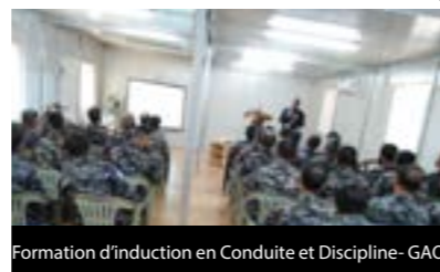
Formation d'induction en Conduite et Discipline- GAO

A ce jour, CDT a déjà formé plus de 15 000 membres de l'ensemble du personnel dans les régions de Bamako, Gao, Tombouctou et Kidal, sur les normes de conduite des Nations Unies.