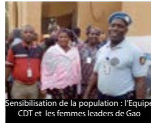
Sensibilisation de la population : l'Equipe CDT et les femmes leaders de Gao

MESURES CORRECTIVES : Dans les cas où les allégations d'exploitation et d'abus sexuels impliquent des membres du personnel de l'ONU (ou personnel apparenté) CDT facilite l'accès aux services d'assistance ou à l'aide d'urgence aux victimes; ceci dans le cadre de la mise en œuvre de la stratégie d'aide aux victimes de tout acte de l'exploitation sexuelle impliquant le personnel de l'ONU. CDT met à jour régulièrement la liste des prestataires de services, facilite la résolution des revendications de paternité et de soutien aux enfants en collaboration avec les bureaux du conseiller juridique et des Ressources humaines pour les cas impliquant des membres du personnel civil et avec les pays contributeurs de troupes ou de police pour le personnel en uniforme.