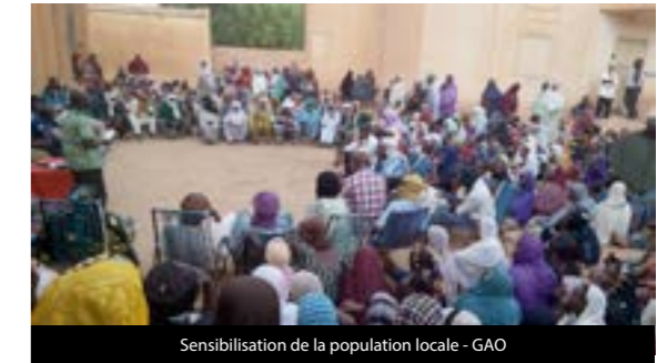
Sensibilisation de la population locale - GAO

CDT a organisé des activités de sensibilisation pour la population locale à Gao et Menaka. Les chefs de la communauté locale, à savoir, le Maire de Menaka, les Chefs de villages et les notables ont participé aux séances de sensibilisation. Les participants ont beaucoup apprécié la sensibilisation et l'information délivrée par CDT. Ils ont demandé que le même message soit diffusé par la radio locale afin de sensibiliser une audience locale plus large. A ce jour, CDT a déjà sensibilisé CDT a pu sensibiliser CDT ha peu pres 3500 membres de la population locale dans les régions de Bamako, Mopti, Timbuktu et Gao sur les normes de conduites des Nations Unies.