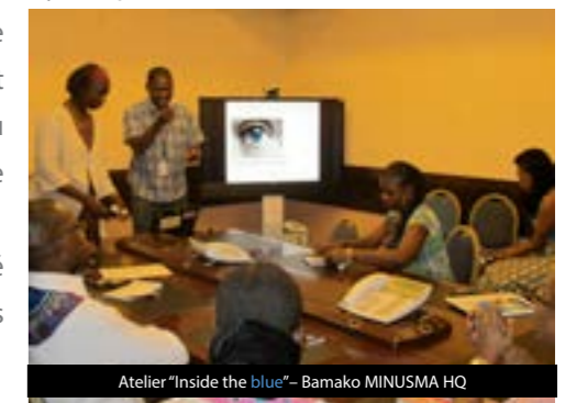
Atelier "Inside the blue" - Bamako MINUSMA HQ

L'Equipe Conduite et Discipline reste disponible pour faciliter les séances de formations au sein des différentes sections de la MINUSMA.