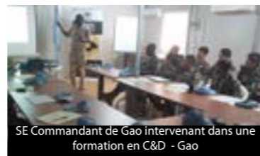
SE Commandant de Gao intervenant dans une formation en C&D - Gao

Le 24th Juin 2015, CDT a été invité à faire une présentation pendant la Conférence des représentants supérieurs nationaux du Commandant de la Force à Bamako. Cette invitation a permis à CDT de sensibiliser les participants quant à leurs responsabilités de développer et de maintenir un environnement qui prévient des actes de mauvaise conduite.