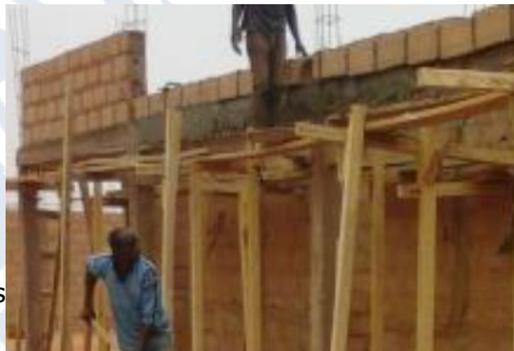
Site de cantonnement de Likrakar, en construction