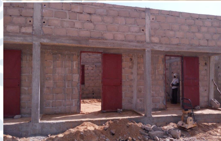
Site de cantonnement de Fafa en construction