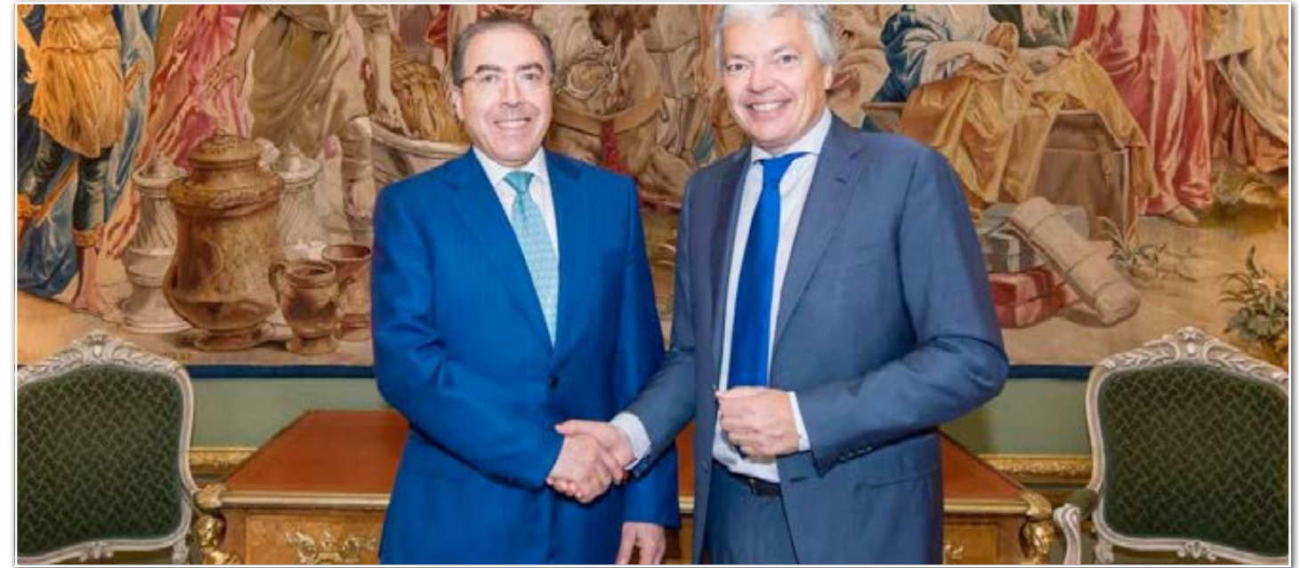
Le chef de la MINUSMA rencontre la haute représentante de l'Union européenne pour les Affaires étrangères et la politique de sécurité et le vice-Premier Ministre et Ministre des Affaires étrangères et européennes de la Belgique

Le Représentant Spécial du Secrétaire Général et Chef de la MINUSMA s'est rendu à Bruxelles pour rencontrer les responsables de l'Union Européenne et échanger sur le soutien des institutions et des pays de l'Europe au rétablissement d'une paix durable au Mali.