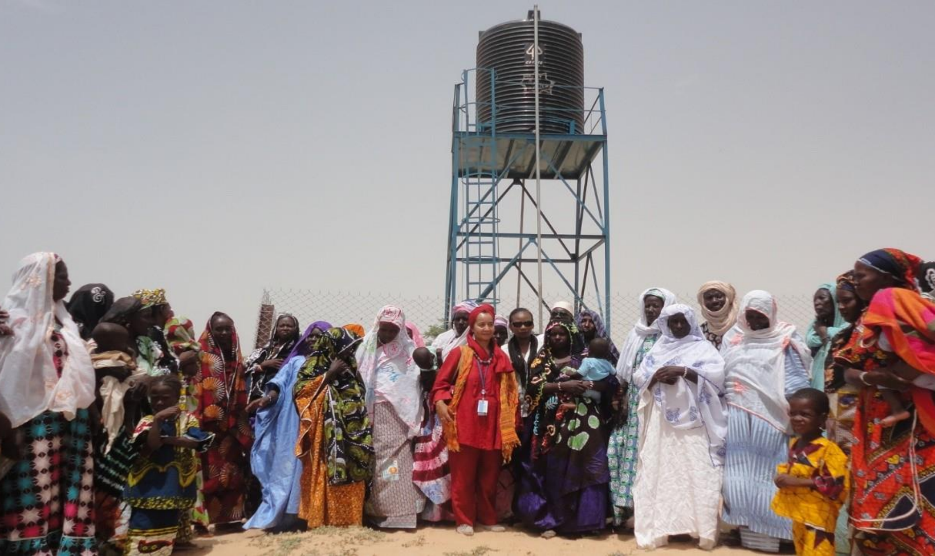
QIPs: Aout 2015. Tombouctou. La réalisation d'une adduction d'eau dans le village d'Amadia bénéficie directement à 600 personnes (les habitants du village) et indirectement aux 1.300 personnes des villages voisins.