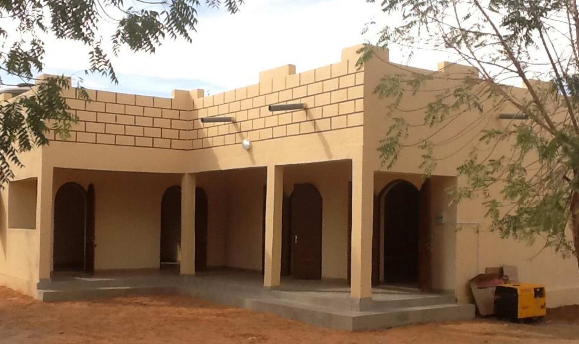
Fond Fiduciaire: Mars 2016. Douentza ( sur la photo ), Kidal et Gao. Construction de sites de stockage de matériel électoral en vue des élections.