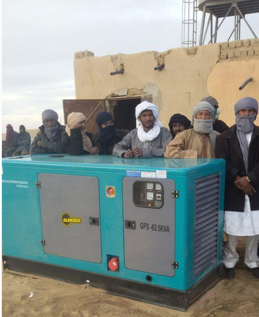
QIPs. Janvier 2016. Kidal: La provision d'un générateur (de 60 kva) pour l'adduction d'eau à Inhalid a eu des retombées directes sur les 9.000 habitants de la commune