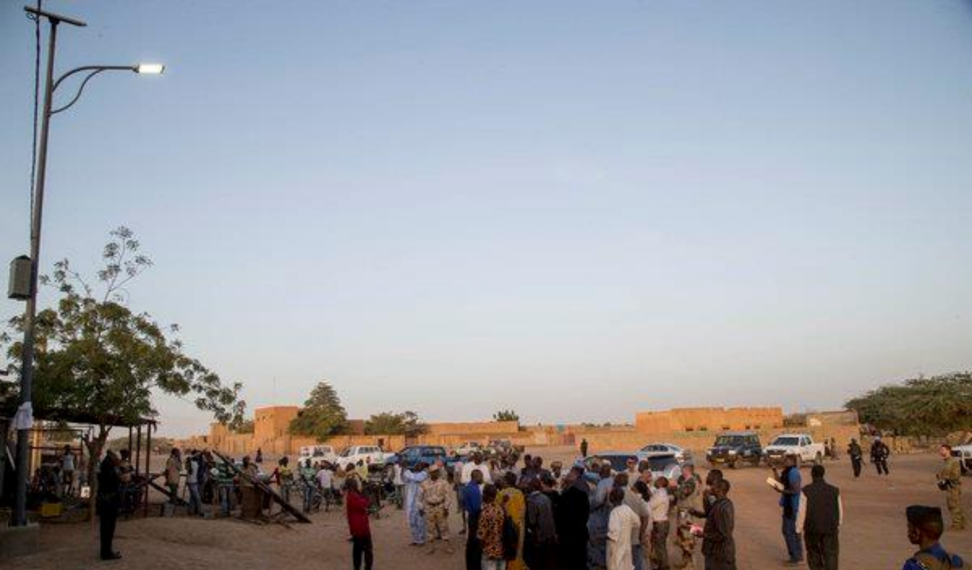
QIPs. Février 2016. Gao. Remise de 72 lampadaires solaires dans 4 rues de Gao pour environ 115 millions de francs CFA.