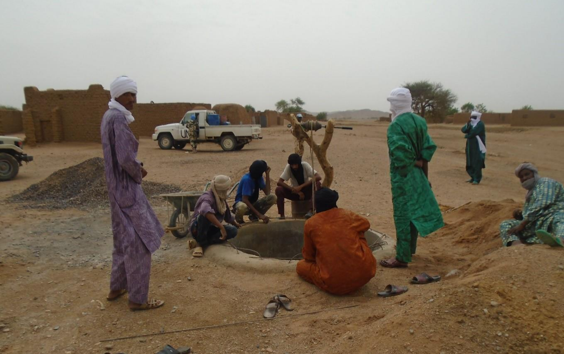
QIPs. En cours. Kidal: Construction d'un puit à Amachach, bénéficiant au 300 familles, soit 1.500 personnes.