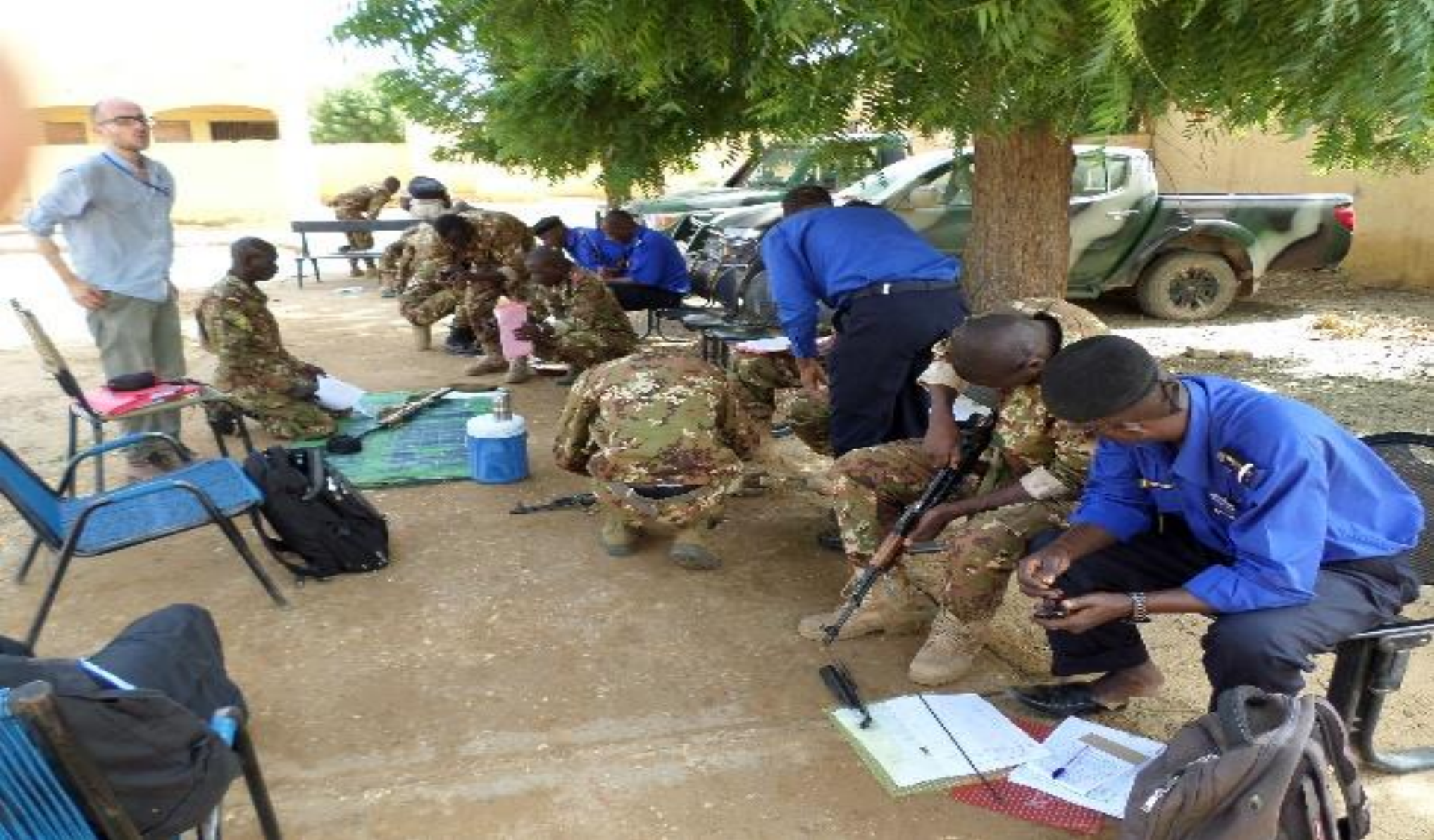
Fond Fiduciaire: Aout-Septembre 2015. Gao ( sur la photo ), Timbuktu et Mopti. 82 personnel des services de sécurité Maliennes ont été formés dans l'identification, l'enregistrement et le traçage des armes et munitions illicites.