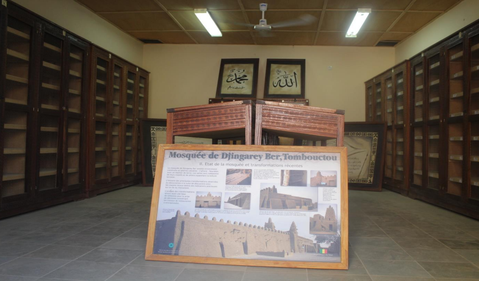
QIPs: Novembre 2015. Tombouctou. Réhabilitation de trois bibliothèques des manuscrits (Imam Essayouti, Al-Wangari et Hamed Boularaf) en vue de la restauration du patrimoine culturel du Mali.