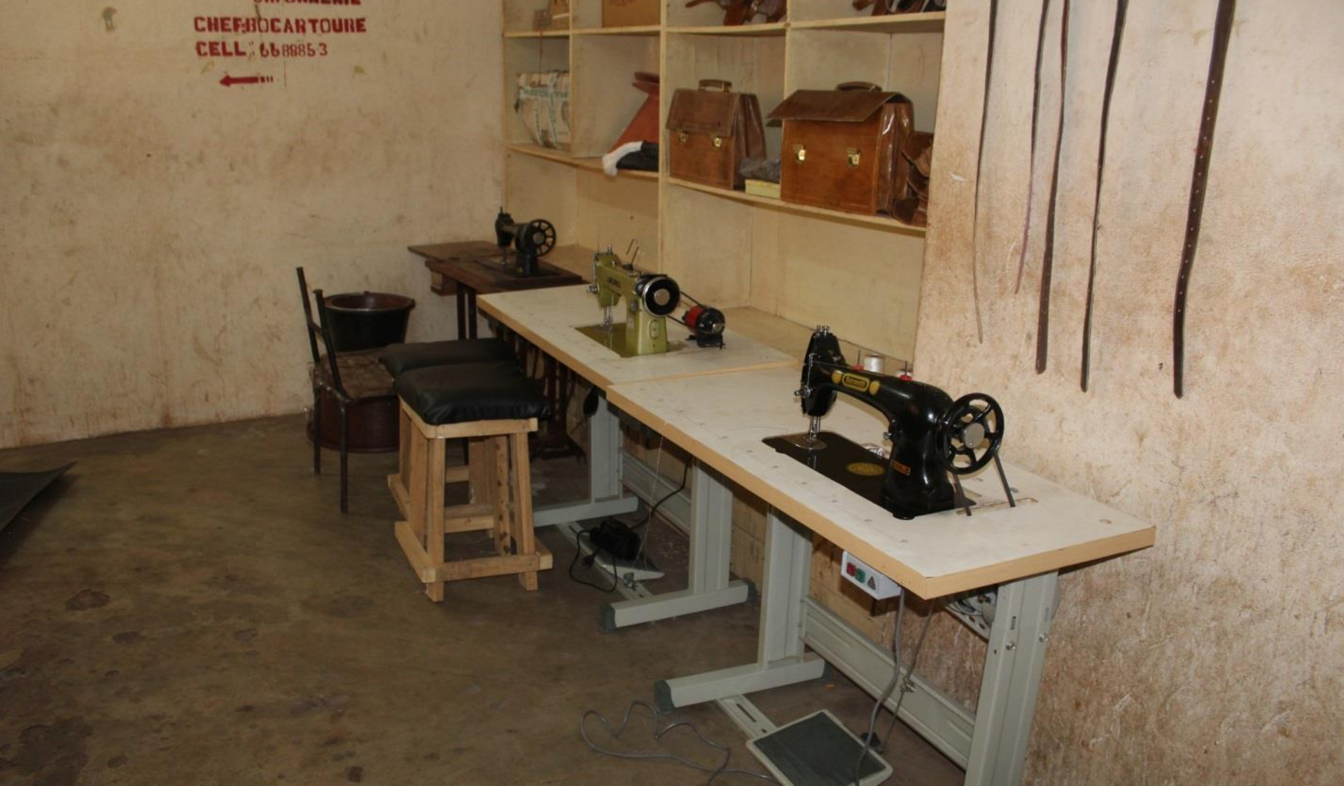
QIPs: Février 2016. Mopti. Projet pour l'autonomisation et l'insertion socio-économique des personnes handicapées dans la Région de Mopti. 118 bénéficiaires. Plusieurs activités, dont l'équipement d'un atelier de cordonnerie en outils.